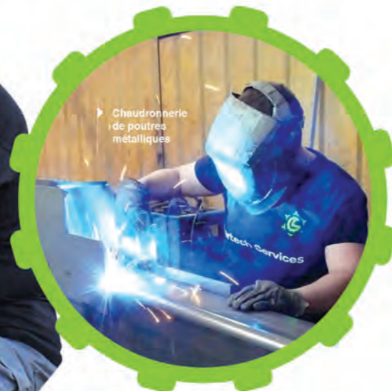
→ Chaudronnerie de poutres métalliques

Possibilité de binôme, tuyauteur et soudeur.