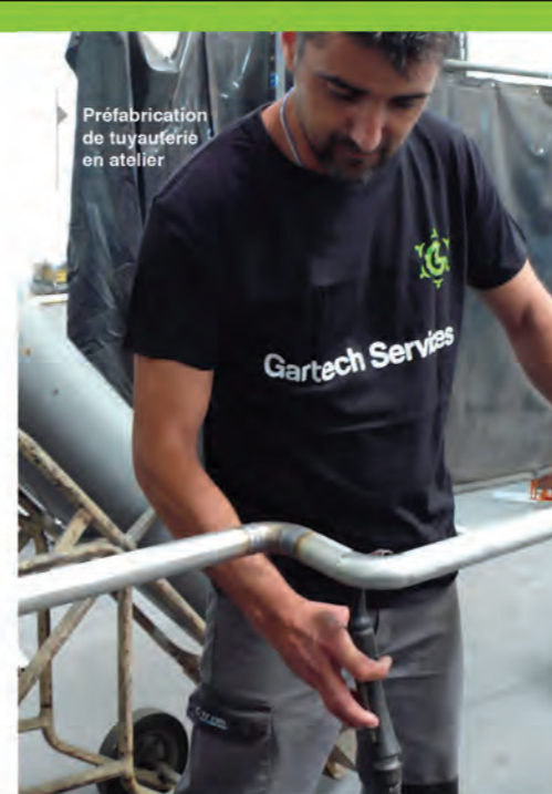
→ Préfabrication de tuyauterie en atelier